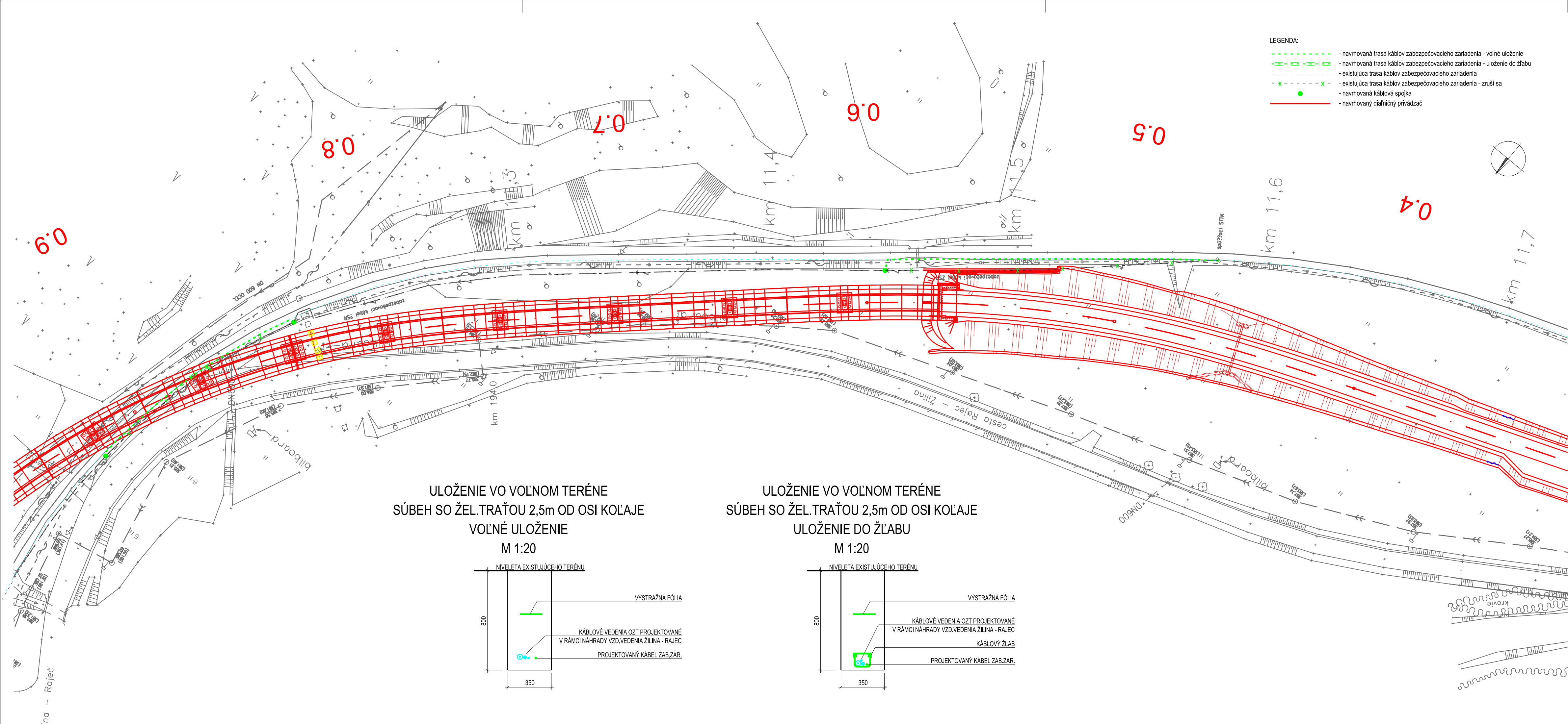
ULOŽENIE VO VOĽNOM TERÉNE SÚBEH SO ŽEL.TRAŤOU 2,5m OD OSI KOĽAJE VOĽNÉ ULOŽENIE M 1:20